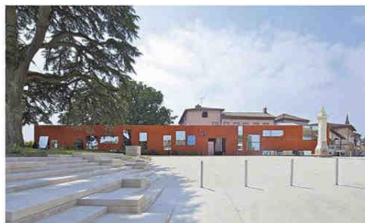
Première œuvre Mairie de Mirabel (Tarn-et-Garonne) Maître d'ouvrage: Ville de Mirabel Architecte: Xavier Lepiaë Architecte