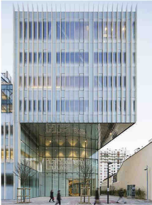
Lieux d'activité Siège social du groupe Hachette Livre à Vanves (Hauts-de-Seine) Maître d'ouvrage: Hachette Livre Architecte: Jacques Ferrier Architectures