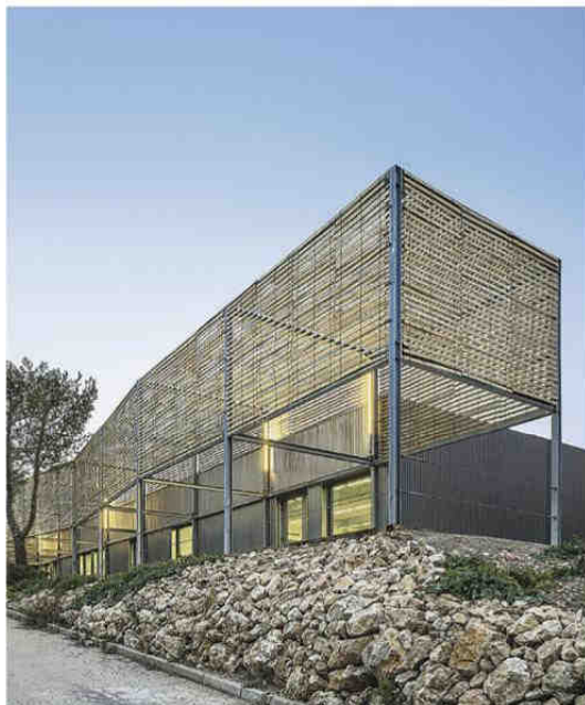
Première œuvre Extension de l'école d'architecture de Marseille Maître d'ouvrage: Ecole nationale supérieure d'architecture de Marseille Architecte: PAN Architecture