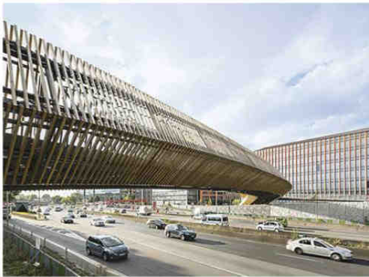
Ouvrages d'art Passerelle sur le périphérique à Paris XIX e Maître d'ouvrage: Semavip Concepteur: DVVD