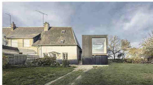
Première œuvre Extension de maison individuelle à Senneville-sur-Fécamp (Seine-Maritime) Maître d'ouvrage: privé Architecte: Antonin Ziegler