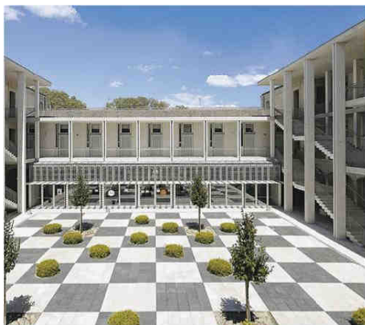
Réhabilitation Pôle universitaire Hoche à Nîmes (Gard) Maître d'ouvrage: Rectorat de l'académie de Montpellier Architecte: Agence d'architecture Jean-Luc Lauriol