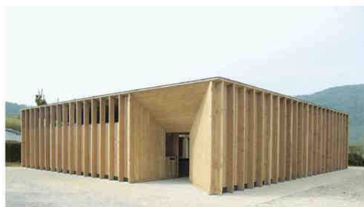
Première œuvre Sanitaires au lac du Lit au Roi à Massignieu-de-Rives (Ain) Maître d'ouvrage: privé Architecte: Régis Roudil