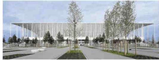
Culture, jeunesse et sport Stade Matmut Atlantique à Bordeaux (Gironde) Maître d'ouvrage: Stade Bordeaux Atlantique Architectes: Herzog & de Meuron avec Groupe-6