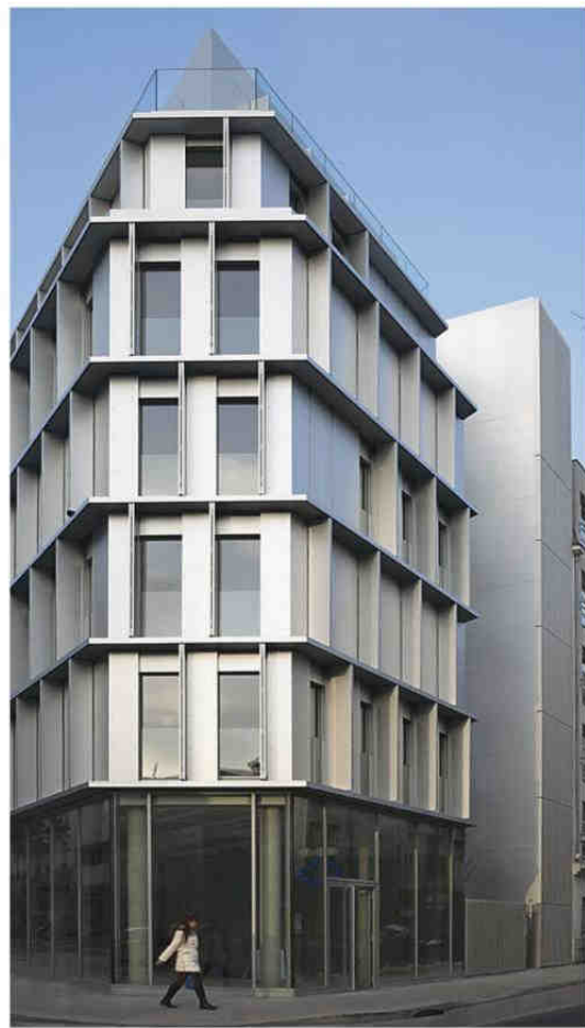
Habitat 18 logements sociaux à Paris XI e Maître d'ouvrage: Siemp Architecte: Babin + Renaud