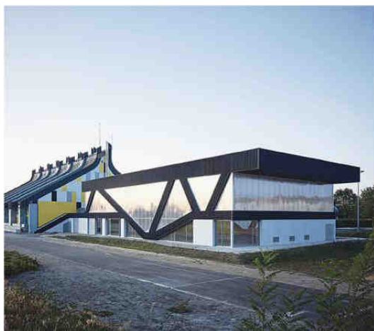
Première œuvre Salle multisports à Champagné (Sarthe) Maître d'ouvrage: Ville de Champagné Architecte: Schemaa